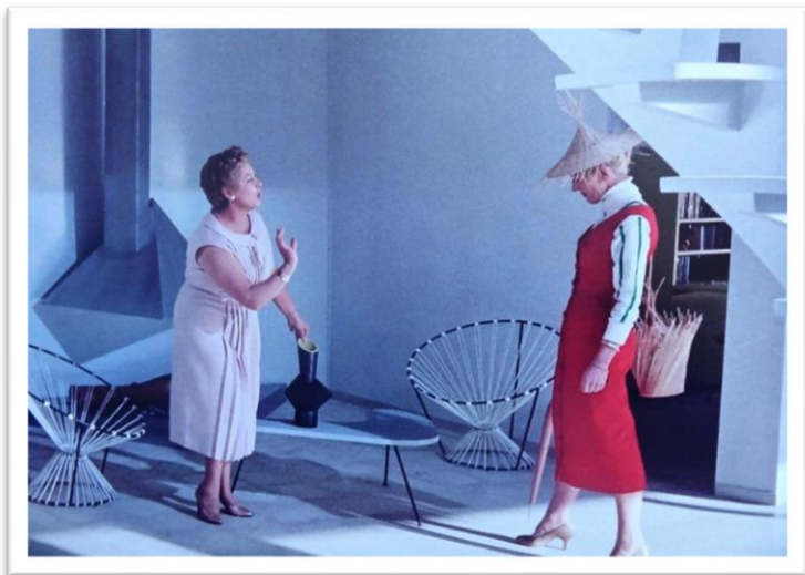
Figure 5 Mon oncle de Jacques TATI 1958