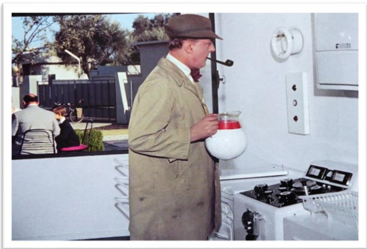
Figure 6 Mon Oncle de Jacques TATI 1958