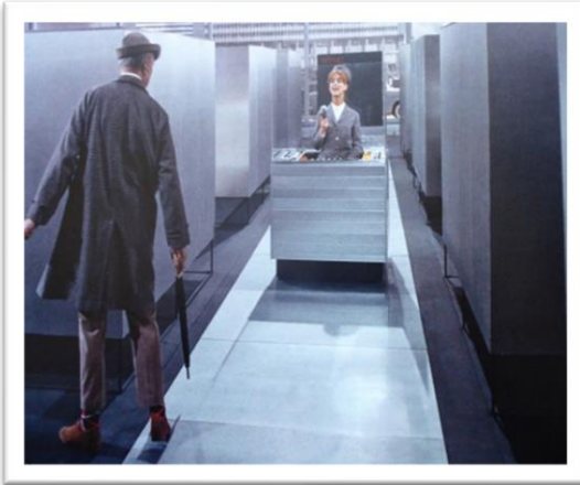
Figure 12 Play Time de Jacques TATI 1967