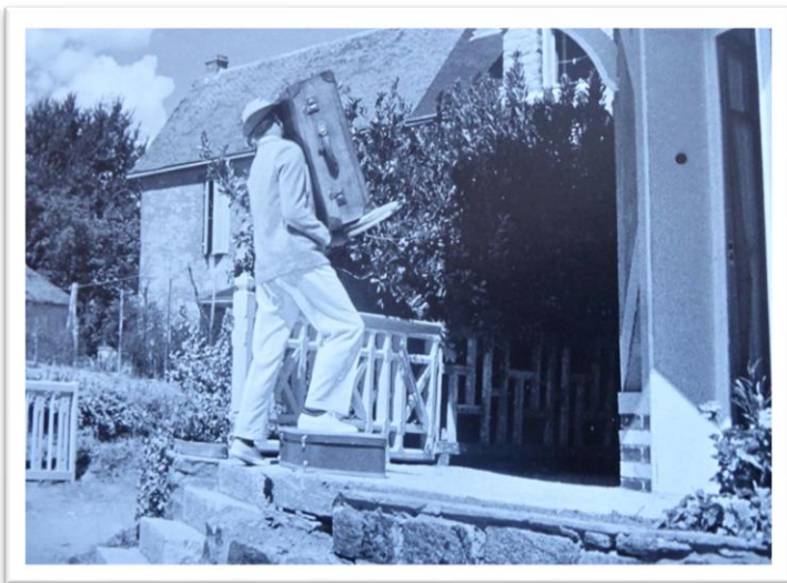
Figure 4 Les vacances de Monsieur Hulot J.TATI 1953