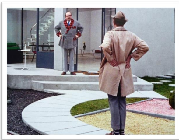
Figure 8 Mon Oncle de Jacques TATI 1958