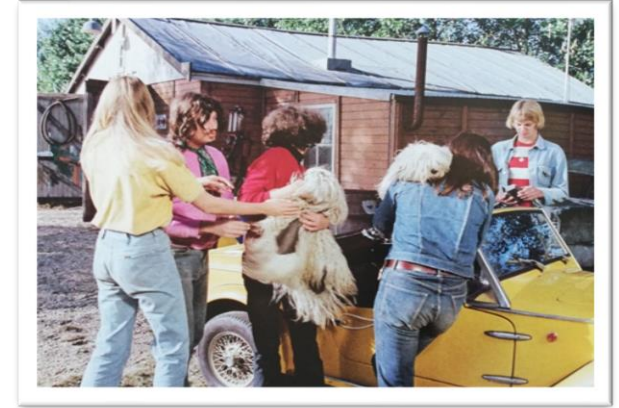
Figure 2 Trafic J. TATI 1971