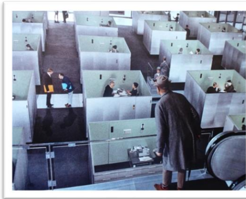
Figure 13 Play Time de Jacques TATI 1967