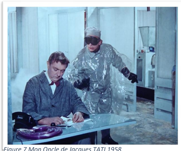
Figure 7 Mon Oncle de Jacques TATI 1958