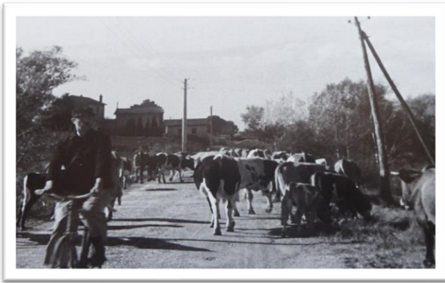
Figure 1: Jour de fête J. TATI 1949