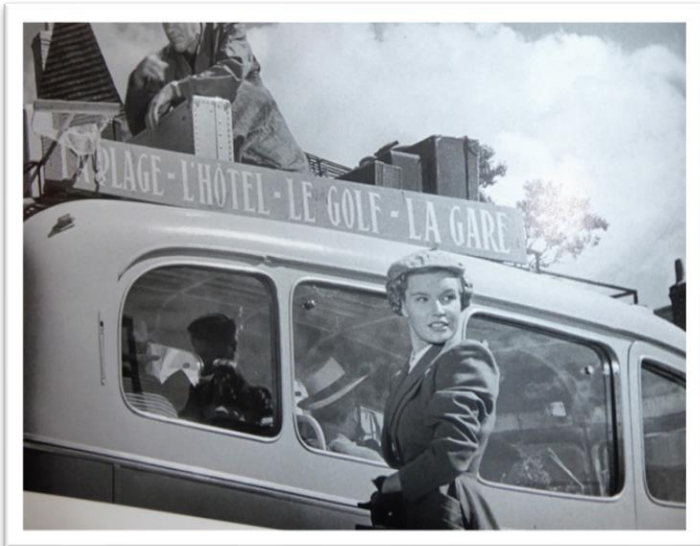
Figure 3 Les vacances de Monsieur Hulot J.TATI 1953