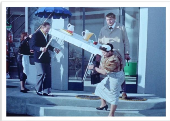
Figure 9 Mon Oncle de Jacques TATI 1958